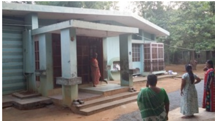
vooral binnen mag er wel weer eens geverfd worden!

Dan terug naar het huidige stafhuis, langs drie cottages. Een ervan is met steun vanuit Nederland twee jaar geleden mooi geverfd, nummer twee ziet er echt verwaarloosd uit en kijk, ook binnen eigenlijk zo niet meer acceptabel. Voor 2000 € zou hier veel ten goede kunnen worden veranderd.