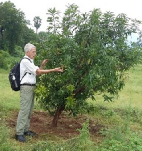
En zo stond hij er eind november 2018 bij: al een paar bloemen!

Nu nog even met de auto naar het jongenshuis in Alamelupuram , hier vlakbij. Wat sneu, veel zieken vandaag hier. Gelukkig niets ernstigs. Kijk, daar achter het huis aan de overkant van de snelweg is nu 3 hectare grond in cultuur gebracht met steun uit Denemarken. Ook hier vooral mango's. Dus nog wel een aantal jaren wachten op goede oogsten. Een solide waterpomp zorgt voor bevoeiing met een druppelsysteem.