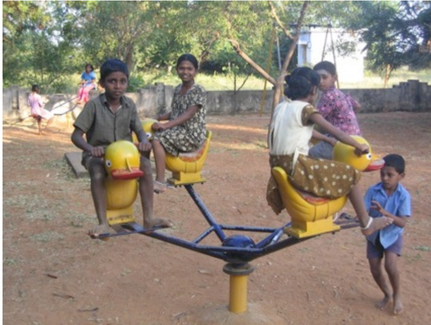
(deze foto is in januari 2009 gemaakt!)

De kleuterspeeltuin is vol gegroeid met onkruid, als het droger wordt zal dat veranderen en kunnen de kleintjes er weer heerlijk ravotten