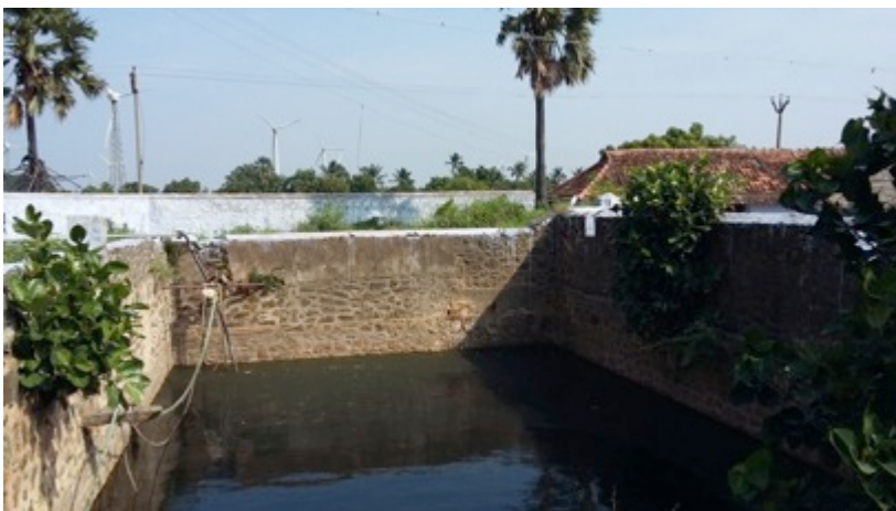
De waterput bij de boerderij is dit jaar helemaal gevuld!