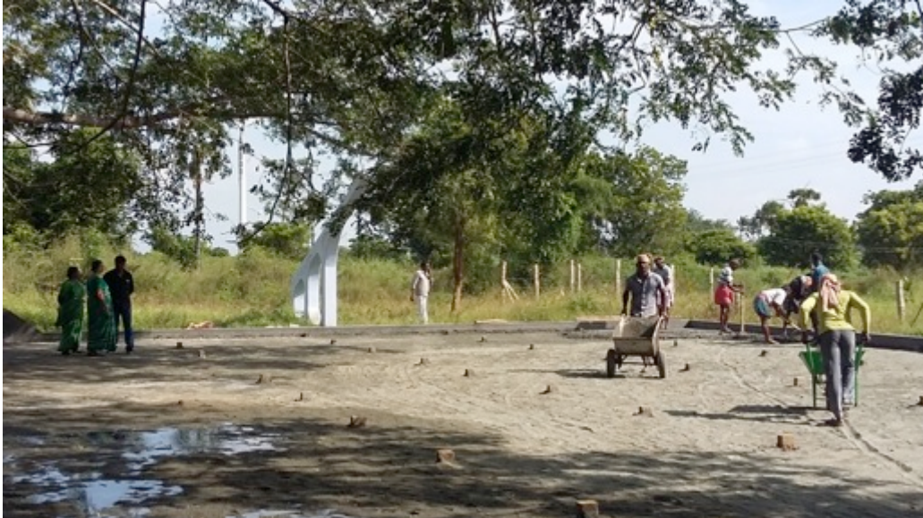
cement storten voor het basketbal veld

Achter het schoollab zijn mannen aan het werk om de vloer van een basketbal veld te storten. Wat een professioneel terrein wordt dat, goed voor wedstrijden tussen verschillende scholen uit de omgeving. Dat behoort dus ook bij het schoolproject 2017 , met dank aan alle Nederlandse donateurs, en onze subsidiegever, Stichting Wilde Ganzen .