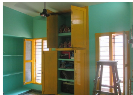
Stichting Vrienden Ashram 4