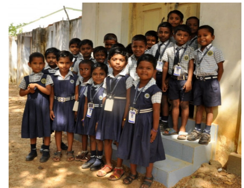
Stichting Vrienden Ashram 1