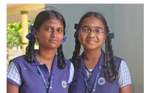
Stichting Vrienden Ashram 3

Vergelijkbaar met de tweede klas middelbare school hier. In uniform, met de haren netjes in een vlecht. Inmiddels gescheiden van de jongens, die in de andere helft van het lokaal zitten. Altijd geconcentreerd en vlijtig. Opstaan wanneer de docent binnenkomt, ongevraagd het bord schoonmaken, op de grond gaan zitten als er een proefwerk is en je niet mag afkijken. Maar ook: snel huiswerk overschrijven voordat de lessen beginnen, even kijken wat de lunchbox schaft. En als je vraagt of ze het leuk vinden op school: ja!!