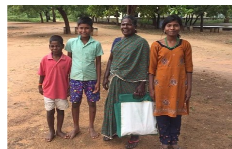
Stichting Vrienden Ashram 2

Op zondag kunnen vader of moeder of soms grootmoeder, hun kinderen in de Ashram bezoeken. We zien enkele blijde kinderen met een vader of moeder. Lang niet alle kinderen krijgen bezoek. Op de foto een grootmoeder met haar drie kleinkinderen; één van de ouders is overleden, de ander is er eenvoudigweg niet. Afwezige ouders, overleden, te ver weg of gewoonweg niet in staat hun kinderen te bezoeken, het is beslist geen uitzondering.