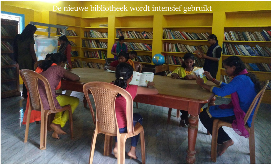
De nieuwe bibliotheek wordt intensief gebruikt